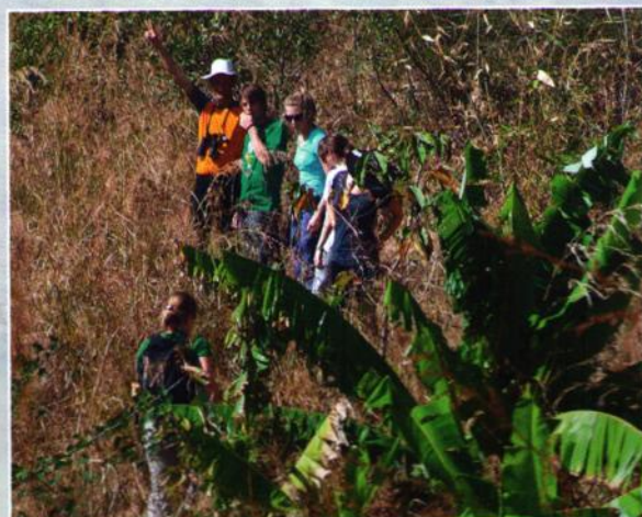
»DSCHUNDEL: Auf dem Gelände des Klosters in Ndanda.