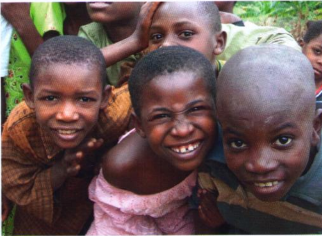
FREUDE: Besuch aus Europa ist herzlich Willkommen.

mittag mit der ASS (Abbey Secondary School): offizielle Begrüßungsreden und Vorstellungen, danach Akrobatik und Theater von Seiten der Schüler und eine Performance von unserer Gruppe.