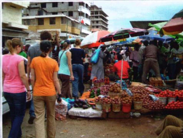
EXOTISCH: Früchte auf dem Markt in Dar es Salaam.