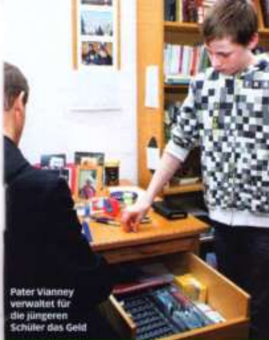
Pater Vianney verwaltet für die jüngeren Schüler das Geld