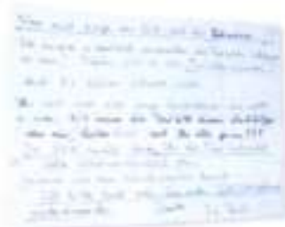
Zettel in der Toilette: Fast alles im Internat ist strikt geregelt

mit einem großen Kreuz an der Wand und einer schwarzen Madonna in der Mitte. Auf der linken Seite sitzen achtzehn Jungen. Sie schreiben, rechnen und zeichnen. Und sie schweigen – Studierzeit bedeutet Schweigezeit. Für mehr als zwei Stunden.